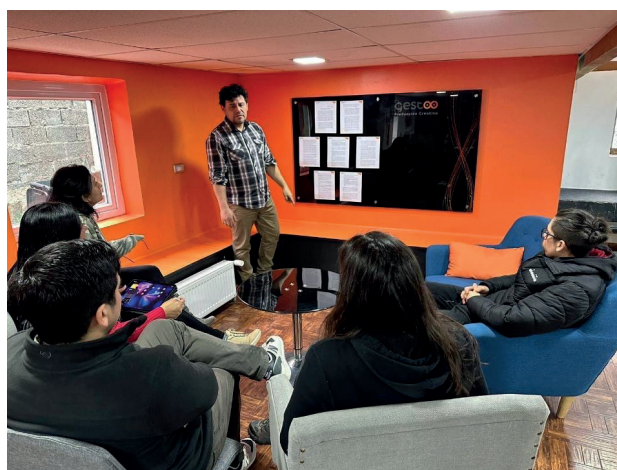
Medio de verificación 2: Fotografía de charla de presentación de Programa de Integridad